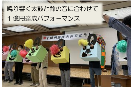
鳴り響く太鼓と鈴の音に合わせて 1億円達成パフォーマンス