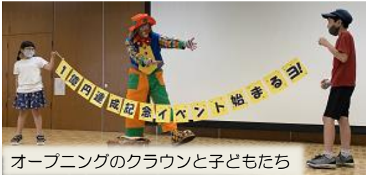
オープニングのクラウンと子どもたち